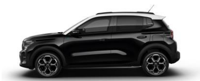
Perla Nera Schwarz (M)